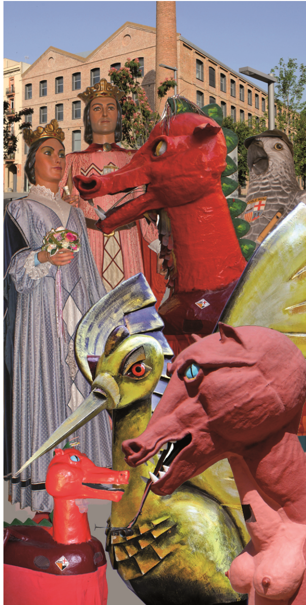
La imatgeria festiva del Poblenou